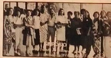
Participantes do Simpósio realizado em Brasília

que não foram restritas apenas à área tecnológica. Estenderam-se também para os aspectos mais gerais da mulher trabalhadora e às brasileiras de todas as classes sócio-culturais.